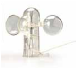
1582021 Ricambio sensore vento