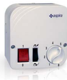
Modulo di controllo