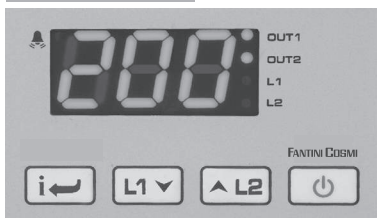
Fig.1 - Pannello frontale