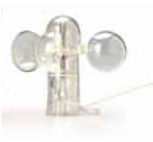
1582022 Ricambio sensore sole e vento