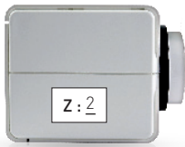
Actuador para instalar en la zona 2