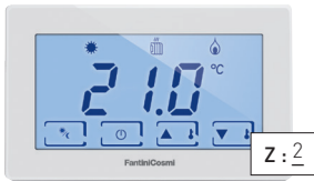
Termostato da installare nella zona 2