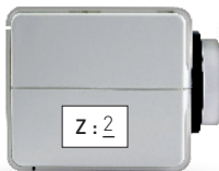
Actuador para instalar en la zona 2