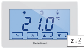
Termostato para instalar en la zona 2